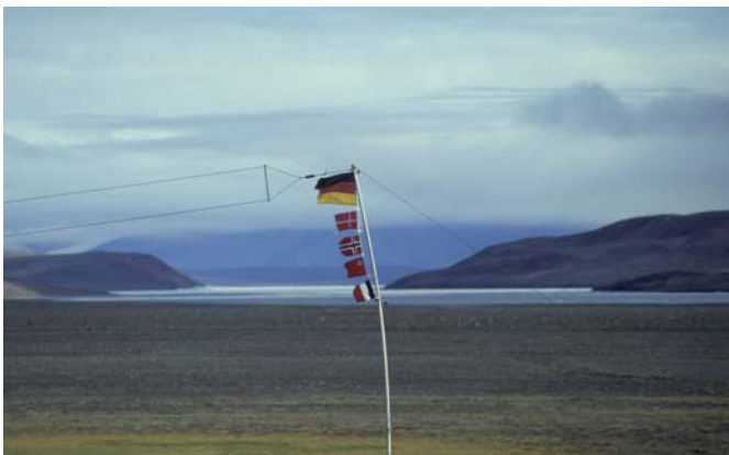
Abb. 1: Polarforschung ist international – Feldlager im Friggfjord, Nord-Grönland.

Die deutsche Beteiligung am Internationalen Polarjahr stand