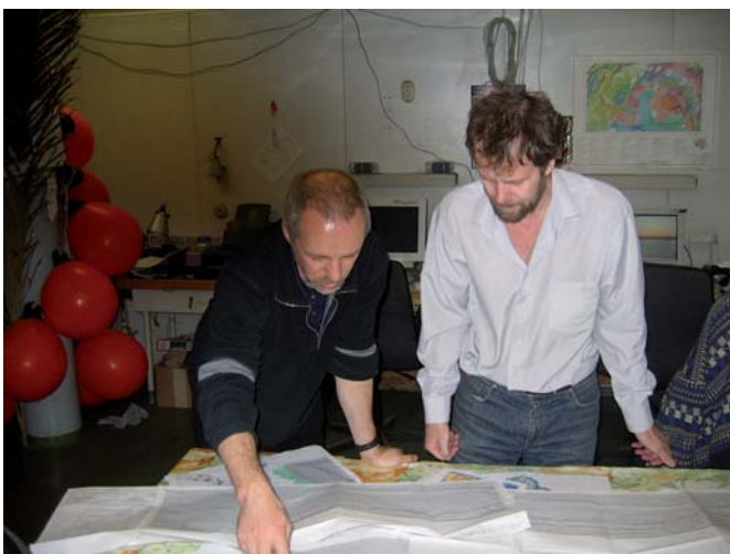
Abb. 4: Operative Abstimmung zwischen deutschen und russischen Kooperationspartnern an Bord des russischen Forschungsschiffes „Akademik Karpinsky“ im März 2007 bei gemeinsamen Messfahrten mit RV „Polarstern“ zum IPY-Projekt Plates & Gates in der Prydz Bay/Antarktis, vgl. Folge 11.

Von Deutschland sind zu den oben angesprochenen Forschungskomplexen eine ganze Reihe von Expeditionen durch-