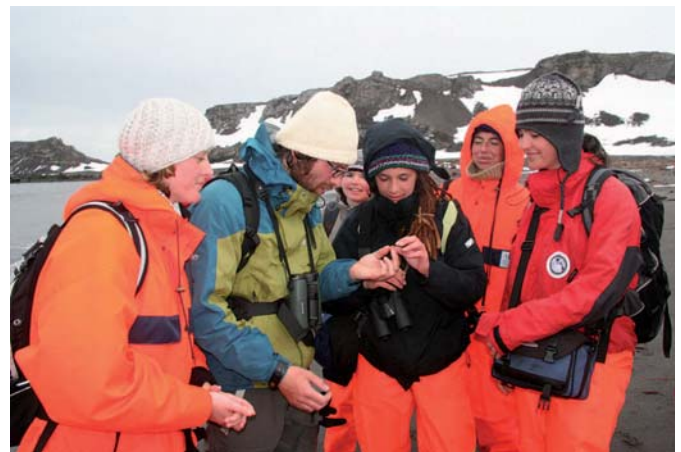
Abb. 5: Studenten erleben auf King George Island, Antarktika, Polarforschung hautnah, vgl. Folge 21.

Ein deutscher Schwerpunkt war auch die Einbeziehung der Jugend in die Aktivitäten des Internationalen Polarjahres. Mit speziellen Programmen für Schüler, Studenten und Lehrer konnten sehr interessante, wirkungsvolle Beiträge geleistet werden (Folgen 3, 13, 17, 19, 21; Abb. 5). Über das von der Robert-Bosch-Stiftung geförderte Projekt „Coole Klassen“ ist schon ausführlich berichtet worden (vgl. Folgen 8 und 9). Das Projekt wird nach dem Internationalen Polarjahr durch die Deutsche Gesellschaft für Polarforschung weitergeführt.