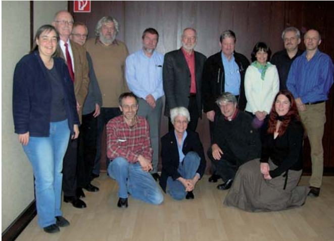
Abb. 3: Mitglieder der Deutschen Kommission für das Internationale Polarjahr 2007/08.

bergen die Polargebiete mit den Eisschilden einzigartige Klimaarchive, die es weiter zu erschließen gilt. Wie in geologischer Vergangenheit reagieren auch heute die Polargebiete besonders sensibel auf Änderungen der Umwelt. Wir können sie sozusagen als Frühwarnsysteme ansehen, bei denen sich früher als in anderen Regionen der Erde Auswirkungen eines Klimawandels zeigen.