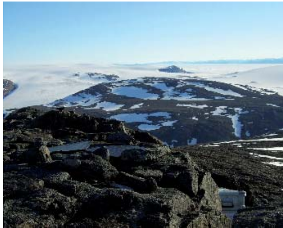
GPS-Permanentstation im Gebiet der russischen Antarktisstation Leningradskaya (Oates-Land, Ost-antarktis)

Für den permanenten Betrieb der Observatorien sind vielfältige technologische Herausforderungen zu meistern, die vor allem die Sicherstellung der Stromversorgung betreffen. Dazu werden als Energiespeicher Akkumulatoren eingesetzt, die natürlich der Nachladung bedürfen. Neben Solarmodulen müssen hier weitere alternative Energiequellen erschlossen werden, die auch während des Polarwinters arbeiten. Dabei entstehen oftmals individuelle Lösungen, die teilweise auf kommerziellen Angeboten aufbauen, z.B. unter Nutzung von Windgeneratoren oder Brennstoffzellen. Weitere technologische Entwicklungen betreffen Aufbau und Thermomanagement sowie die Einrichtung von satellitenbasierten Kommunikationsverbindungen für die Abfrage von Statusinformationen und eventuell sogar für die Datenübertragung.